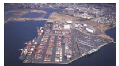
博多港の香椎パークポート

玄界灘に面した政令指定都市・福岡市は、人口120万人を超え、九州・山口における中枢都市として発展しています。福岡市経済の基本を市内総生産で見ると、約6兆2000億円(平成6年)で、日本の国内総生産の約13%にあたります。