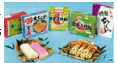
日奈久温泉の竹輪

八代は、全国有数の干拓地、水量豊かな琢磨川、静かな内海・八代海、温暖な気候など恵まれた条件の中で、農業や工業、水産業などが栄えています。農業では、日本一の生産量を誇る「い草」をはじめ、品質の高い「メロン」、「トマト」などの施設園芸が盛んです。工業では、琢磨川の豊かな水などを活かして、製紙やアルミ、アルコール、セロハンなどの生産が行われています。水産業では、タイ、クルマエビ、ヒラメをはじめ、琢磨川の鮎などが全国に知られています。八代海の新鮮な魚を原料として作られる竹輪・かまぼこ・天ぷらなどは、古くから日奈久温泉の土産物として親しまれています。