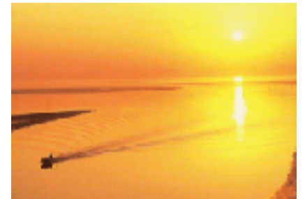
八代海に沈む夕日

八代海は、通常は穏やか海ですが、1999年9月に通過した台風18号により、八代海の北部沿岸に高潮が押し寄せ、湾奥の不知火町において死者・浸水被害が出ています。