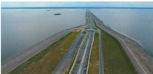
サンクトペテルブルク洪水防御ダム

会議開催地のサンクトペテルブルクは閉鎖性海域であるバルト海に面しています。街は低湿地に築かれており、バルト海から押し寄せる高潮で何度も大洪水に見舞われてきました。このため街の沖合部には高速道路を兼ねた洪水防御ダム（全長25km）が建設されるなど、街は防災と環境の両方の問題に直面しています（テクニカルツアーの視察地）