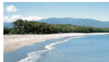
白砂青松の高田松原海岸

湾口の広田崎（青松島・椿島）は、波間に点々と顔をのぞかせる岩礁です。どちらの島もウミネコの繁殖地で、青松島は県の名勝・天然記念物、椿島は国の天然記念物に指定されています。