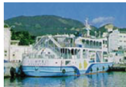
加計呂麻フェリー

湾奥の瀬相は、大島本島の古仁屋港と結ぶ「加計呂麻フェリー」の発着場となっています。