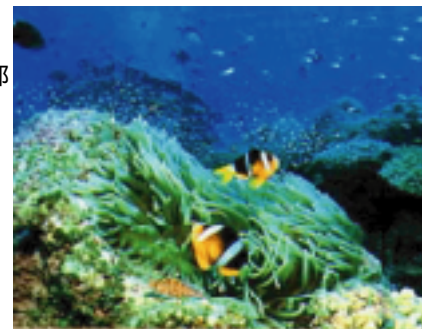
大島海峡のサンゴ礁

三浦湾が面する大島海峡でみられる造礁サンゴは、約60属200種以上ともいわれています。近年も新種が発見されていることからいまだ未知の部分をもった海といえます。このように多種多様なサンゴが生息しているのは、大島海峡が太平洋と東シナ海を結ぶパイプのような形をしており、そのため新鮮なプランクトンや栄養分が絶えずスムーズに流入していることが大きな原因と考えられています。また、海峡はさみ島の両岸の海岸線が深く入り組み、風の直撃を受けることも少なく、加計呂麻島が外洋からの自然の防波堤になっていることもサンゴの生育を促している要因と考えられます。