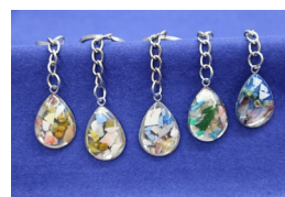
海ごみキーホルダー